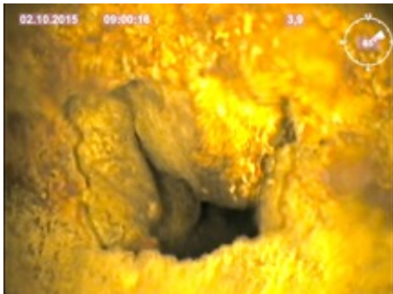
Nach ca. 3,9 m wurde das erste Loch gefunden.