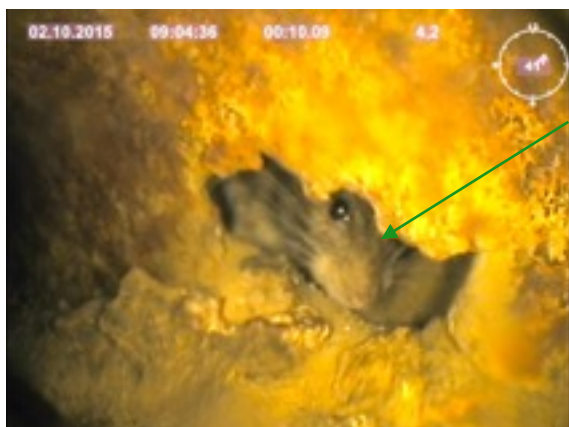
Nach 4,2 m wurde das zweite Loch gefunden, wo auch ein Besucher angetroffen wurde.