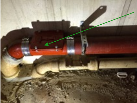
Prüfungseingang im Außenkeller

Am 02.10.2015 wurde eine Kamerafahrt im Objekt, ..... in ..... Berlin durchgeführt.